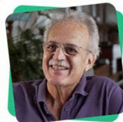
Dr Carlos Nobre, Pesquisador Climático Urgência climática